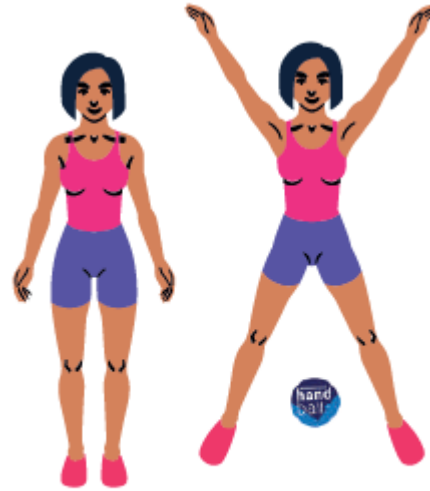
2 - Jumping Jack