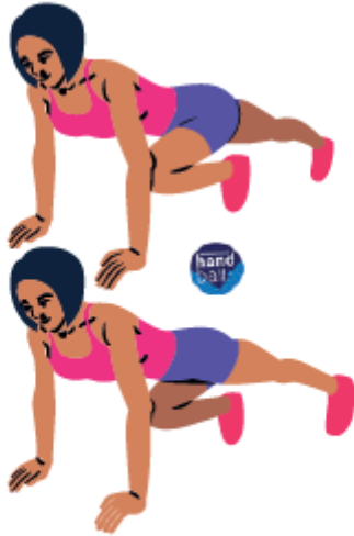
1 - Mountain Climbers