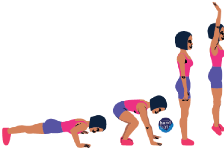
3 - Burpees